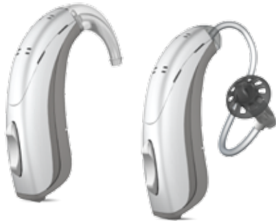
TABLA DE COMPATIBILIDAD